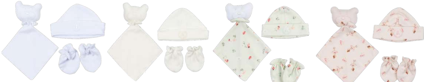
Cor 01 Cor 11 Cor 244 Cor 249

KIT PRESENTE 3PÇS Par de luvas, touca e naninha Ref. 26.072 Tamanho Único Naninha avulsa Ref. 26.073