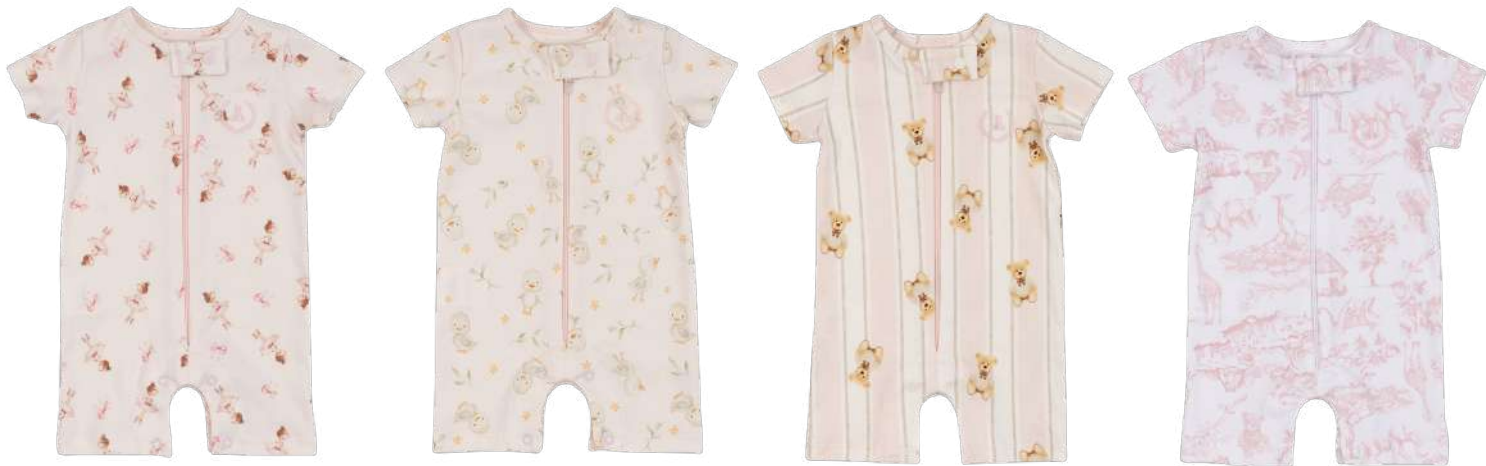
Cor 249 Cor 250 Cor 251 Cor 253