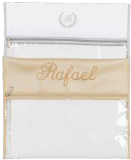
Opc. Tecido e Bordado