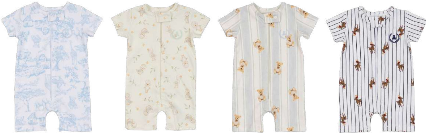
Cor 254 Cor 255 Cor 256 Cor 258