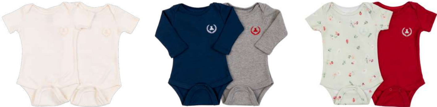
Cor 11 Cor 17 Cor 244