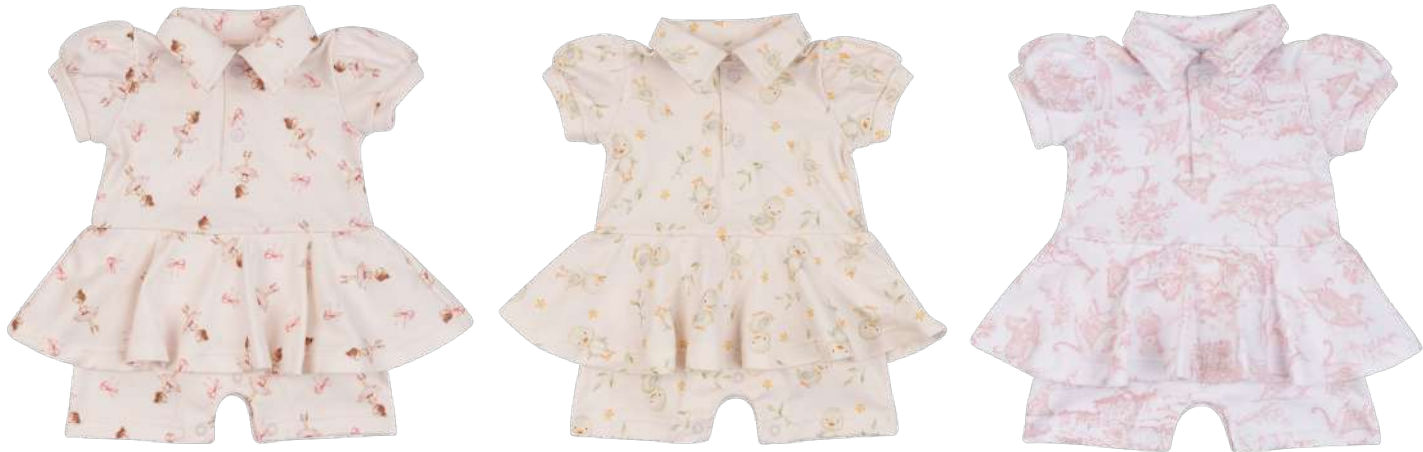
Cor 249 Cor 250 Cor 253