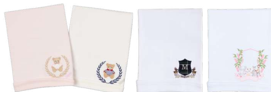
Manta de Suedine 26.016