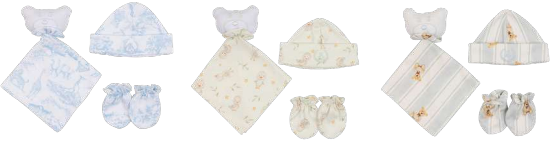
Cor 254 Cor 255 Cor 256