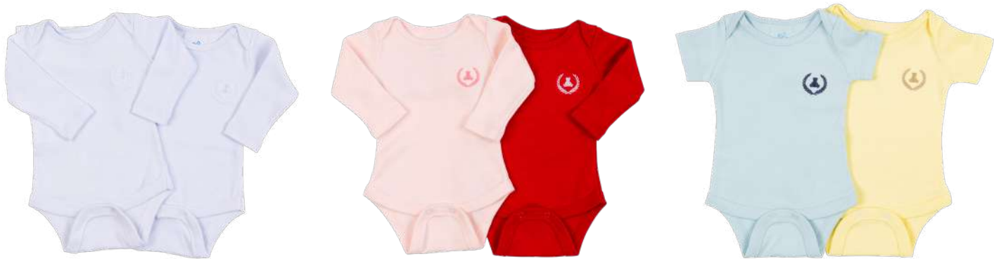
Cor 01 Cor 02 Cor 03

COLEÇÃO TRADICIONAL Cores 01, 02, 03, 11, 17, 244, 249, 250, 251, 252, 253, 254, 255, 256, 257, 258, 259 KIT BODY MANGA CURTA 2PÇS Ref. 26.085 RN / 0-3 / 3-6 / 6-9 / 9-12 / 12-18 / 18-24 meses KIT BODY MANGA LONGA 2PÇS Ref. 26.086 PR / RN / 0-3 / 3-6 / 6-9 / 9-12 / 12-18 / 18-24 meses