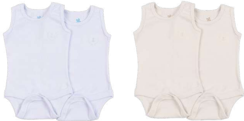
Cor 01 Cor 11

KIT BODY REGATA 2 PÇS RN / 0-3 / 3-6 / 6-9 / 9-12 / 12-18 / 18-24 meses Ref. 26.084