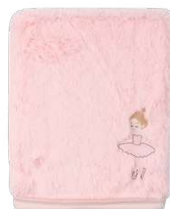
Cobertor Super Luxo 26.013