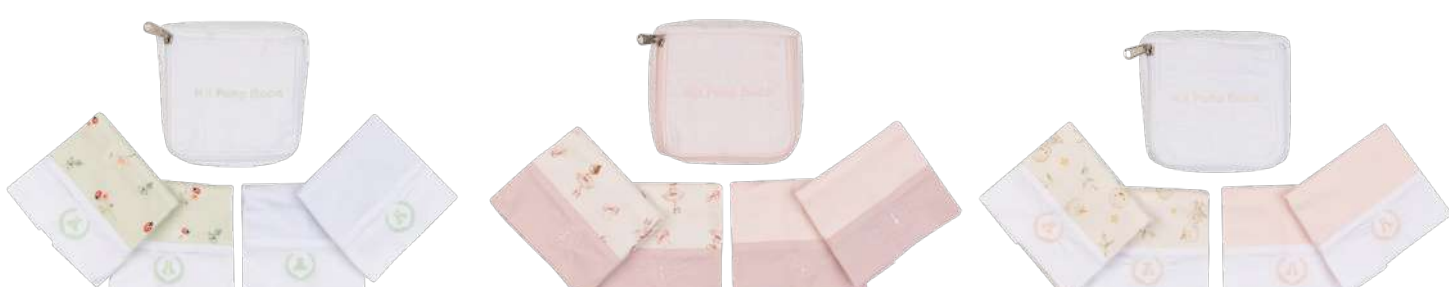
Cor 244 Cor 249 Cor 250

KIT NECESSAIRE PANO DE BOCA 04 peças + 1 necessaire Malha Ref. 26.074