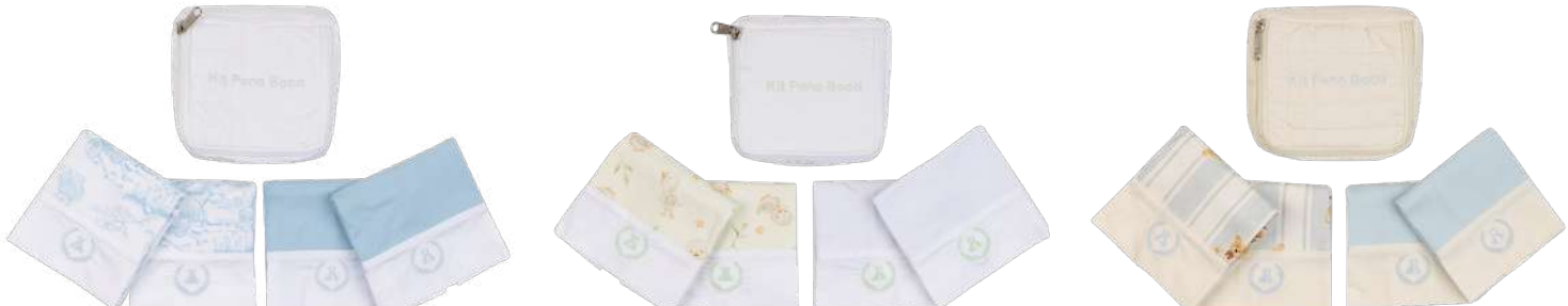
Cor 254 Cor 255 Cor 256