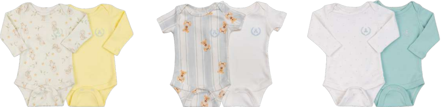
Cor 255 Cor 256 Cor 257