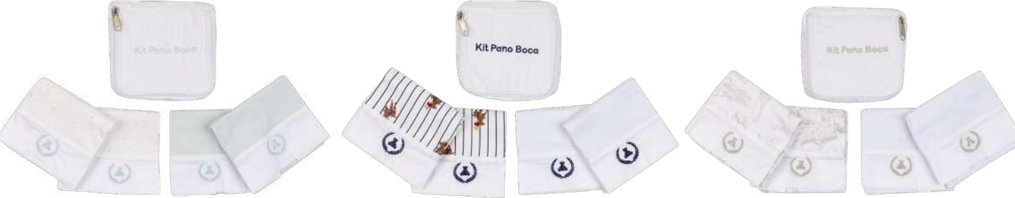
Cor 257 Cor 258 Cor 259