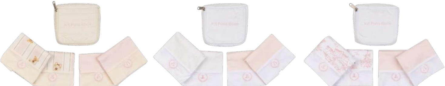
Cor 251 Cor 252 Cor 253