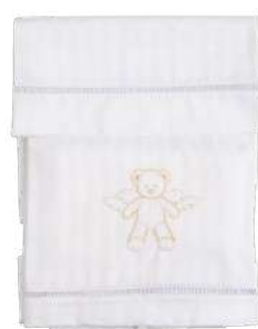
Jogo de Lençol 03 Pçs 26.011