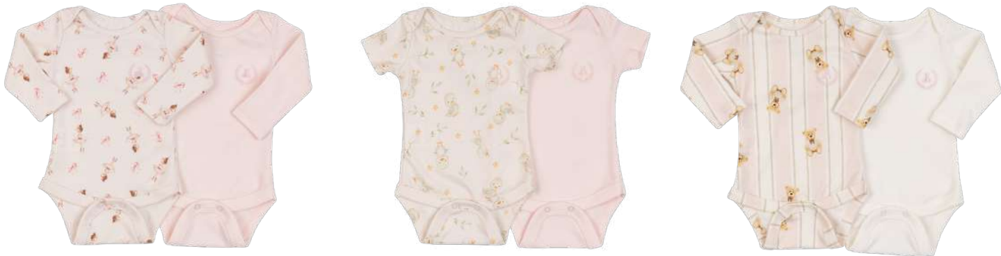
Cor 249 Cor 250 Cor 251