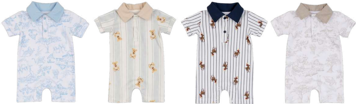
Cor 254 Cor 256 Cor 258 Cor 259