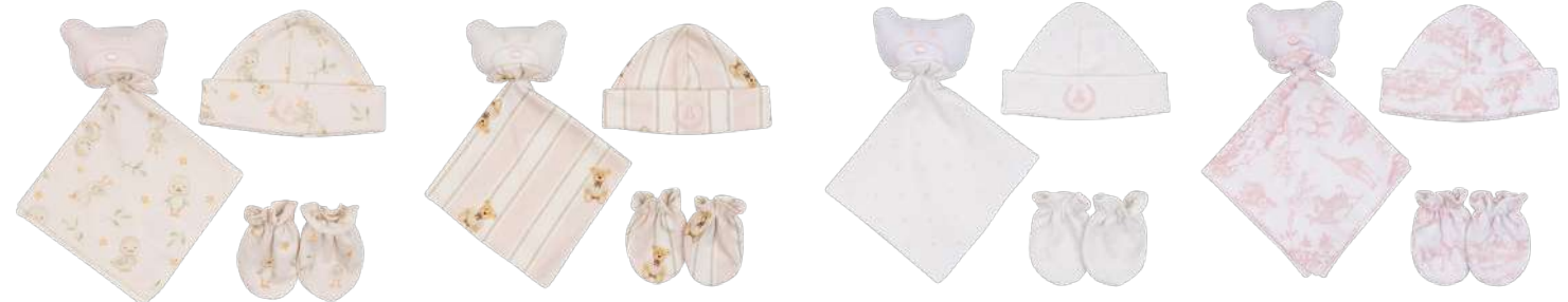
Cor 250 Cor 251 Cor 252 Cor 253