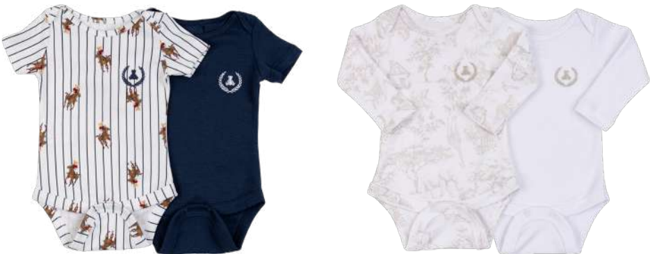
Cor 258 Cor 259