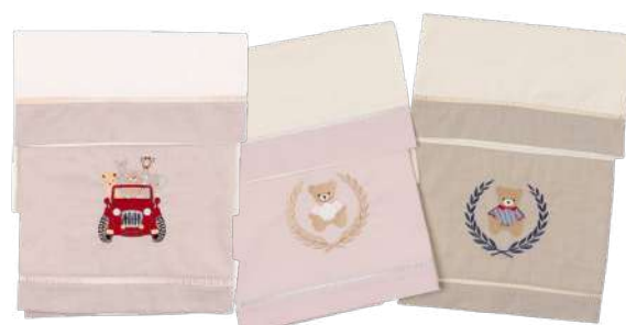
Jogo de Lençol 03 Pçs 26.012