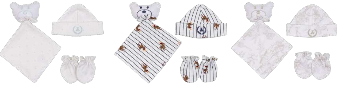
Cor 257 Cor 258 Cor 259

KIT NECESSAIRE PANO DE BOCA 04 peças + 1 necessaire Malha Ref. 26.074