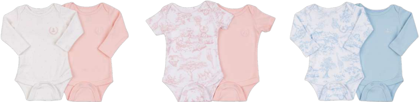
Cor 252 Cor 253 Cor 254