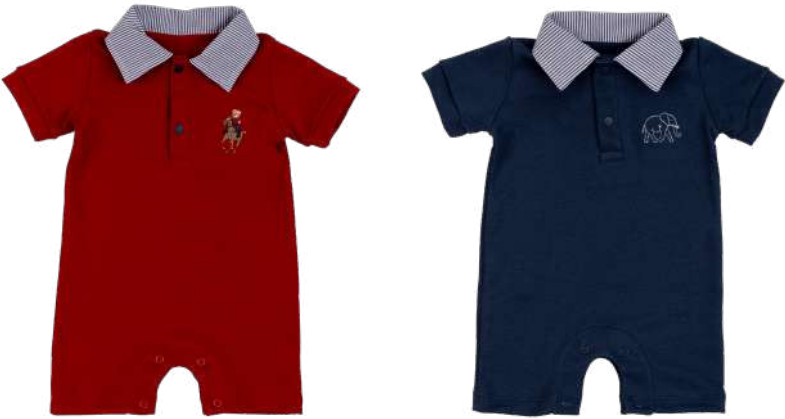
Cor 05 Cor 17