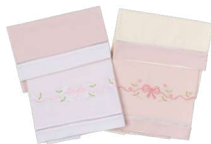
Jogo de Lençol 03 Pçs 26.010